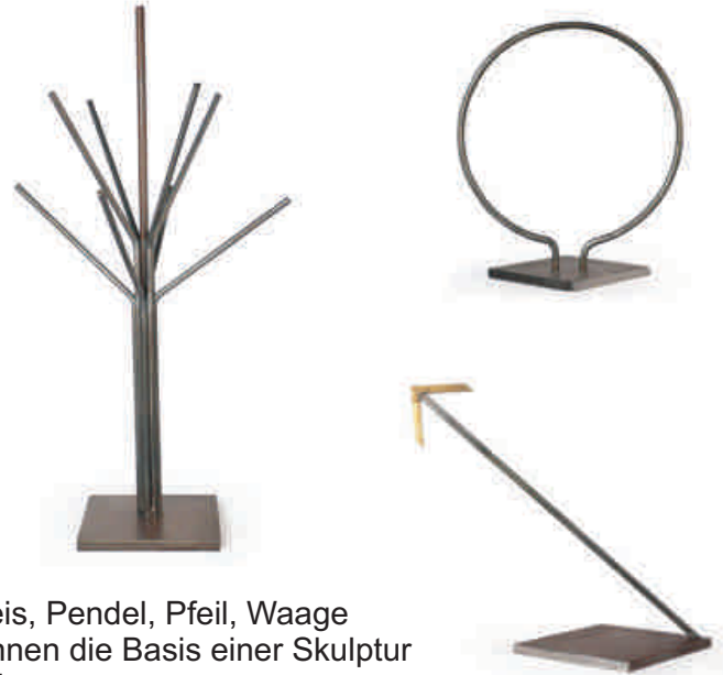
Kreis, Pendel, Pfeil, Waage können die Basis einer Skulptur bilden

Dieses Seminar ist für Gruppengrößen bis zu 22 Personen