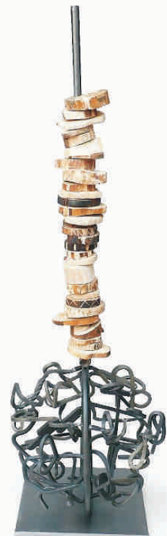
So könnte ihre fertige Teamskulptur aussehen